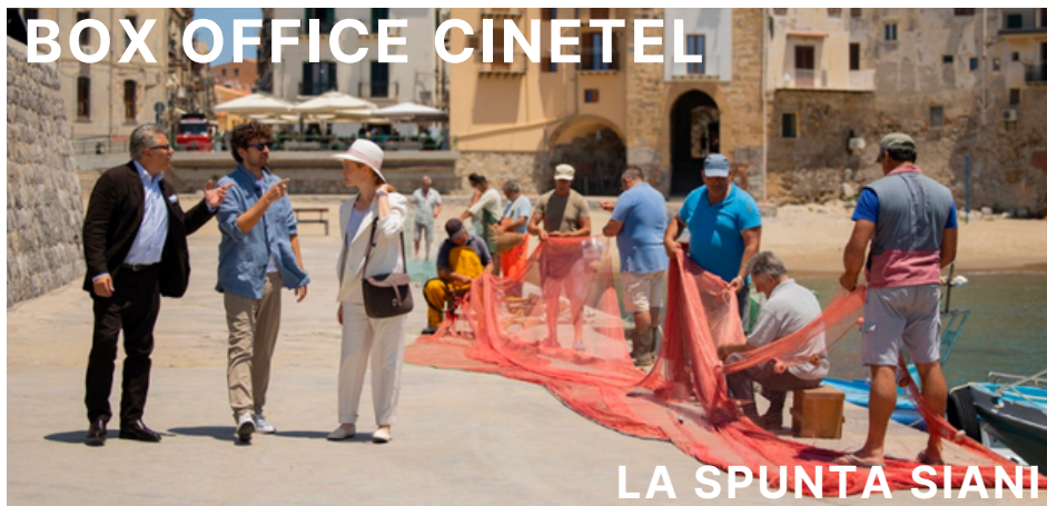
LA SPUNTA SIANI

Dopo un serrato testa a testa, nel weekend Cinetel 4-7 gennaio è primo Succede anche nelle migliori famiglie di Alessandro Siani (01), 2,1 milioni di euro in 425 cinema (media: 4.948 euro), totale 3,86 M€ e 533mila presenze. Secondo Il ragazzo e l'airone (Lucky Red), 1,97 M€ in 429 cinema (media: 4.595 euro), totale 3,94 M€ e 525mila presenze. Terzo Wish (Disney), 1,59 M€ e totali 8,07 M€ e 1,15 milioni di spettatori, seguito da Wonka (WB), 1,53 M€ e in totale 12,85 M€ e 1,7 milioni di spettatori. Quinto al debutto 50km all'ora (Eagle), 1,14 M€ e 156mila presenze in 430 cinema (media: 2.671 euro), sesto Come può uno scoglio (Vision/Universal), 1,08 M€ e totali 3,39 M€ con 469mila presenze. C'è ancora domani (Vision/Universal) è settimo con 811mila euro e in totale 34,53 M€ e 5,05 milioni di presenze; ottavo Aquaman e il regno perduto (WB), 749mila euro, totale 5,14 M€ e 660mila presenze. Seguono due debutti: nono Perfect days (Lucky Red), 651mila euro in 148 cinema (media: 4.402 euro), totale 670mila € e 95mila presenze; decimo Wonder - White Bird (Medusa/Notorious), 435mila euro e 61mila spettatori in 307 cinema (media: 1.419 euro).