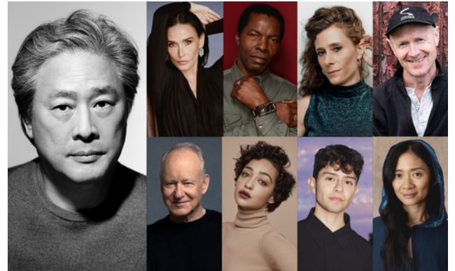
Da sinistra a destra